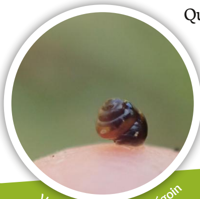
Vertigo sp.

Quelques inventaires ont été menés récemment dans les prairies humides qui bordent le Corchon dans l'objectif de mettre au jour la présence de Vertigos. Ces petits mollusques patrimoniaux de 2 à 4 mm à la carapace enroulée vivent, selon les espèces, soit sur les feuilles et tiges de laïches et de joncs soit dans la litière composée par la dégradation de ces mêmes feuilles.