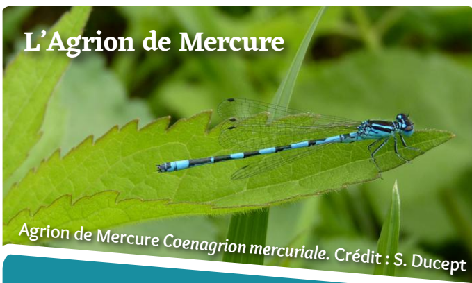
Agrion de Mercure Coenagrion mercuriale .

Cette espèce affectionne les zones de sources, les têtes de bassins et les petits ruisseaux ensoleillés et bien oxygénés pourvus d'une végétation abondante, notamment en Ache faux-cresson. Les adultes y sont observables dès le mois de mai et jusqu'en août.