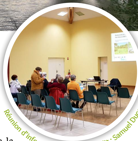
Réunion d'information en 2022.

Une animation scolaire a eu lieu avec une classe de maternelles de la commune de la Trimouille en juin 2022 : 14 enfants à la découverte des petites bêtes. Ils ont ainsi pu s'émerveiller devant le petit peuple de l'herbe.