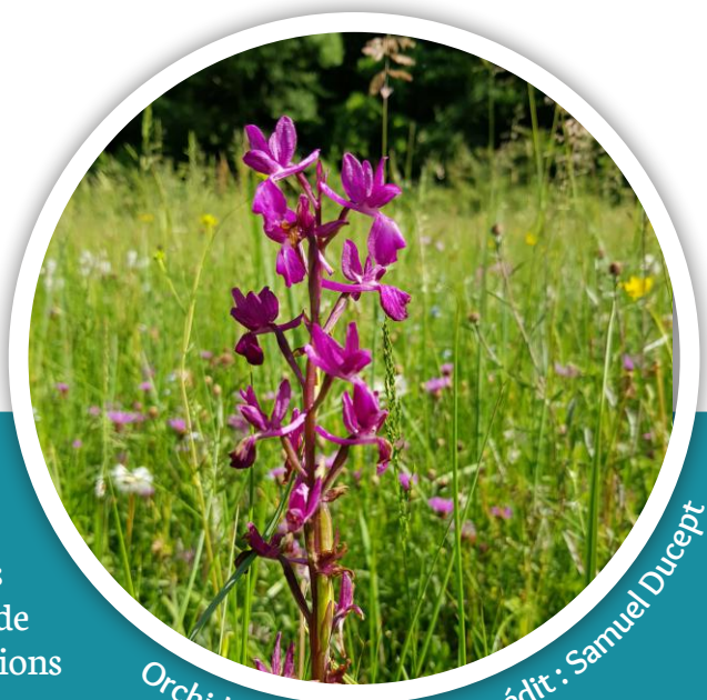
Orchidée à fleurs lâches.

Les associations qui exercent des activités sur le site Natura 2000 (randonnée, pêche...) peuvent signer la Charte Natura 2000, même si elles ne sont pas propriétaires, pour labelliser leurs activités et valoriser leurs bonnes pratiques sur le site.