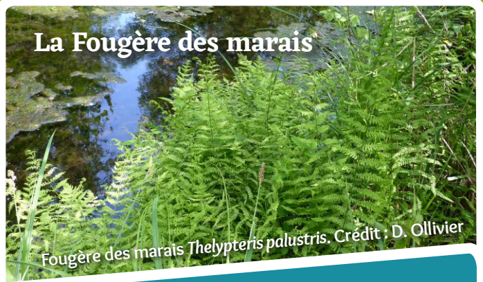
Fougère des marais Thelypteris palustris .

Cette élégante plante qui peut atteindre un mètre de hauteur est rare sur le cours du Corchon. Elle n'est actuellement connue que sur une station au lieu-dit La Ratière mais elle est potentiellement implantée ailleurs.