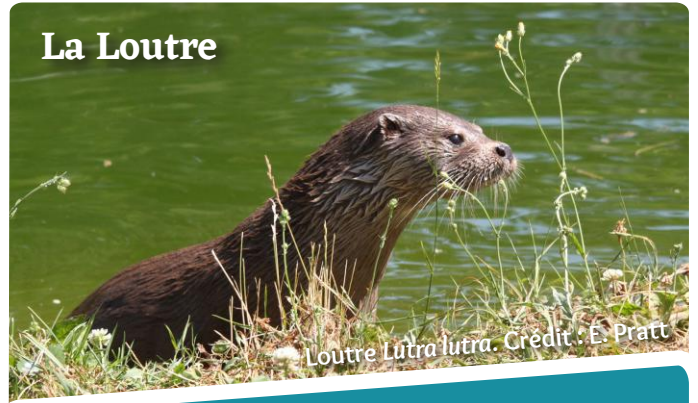
Loutre Lutra lutra .

Habitante discrète de nos cours d'eau, la Loutre a repris possession de son territoire depuis une vingtaine d'années. Les populations sont en plein essor et les travaux de transparence des ouvrages d'art (franchissables par les animaux aquatiques) permettent la colonisation de nouveaux secteurs à l'amont des bassins.