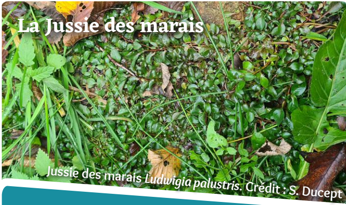
Jussie des marais Ludwigia palustris .

Contrairement à ses cousines américaines introduites et envahissantes, la Jussie des marais Ludwigia palustris est patrimoniale (déterminante pour la désignation des ZNIEFF en Nouvelle-Aquitaine).