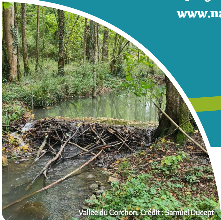
Vallée du Corchon.

Le site internet du programme Natura 2000 en France : www.natura2000.fr