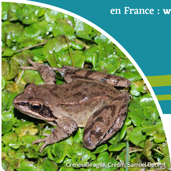
Grenouille agile.

Le site internet du programme Natura 2000 en France : www.natura2000.fr