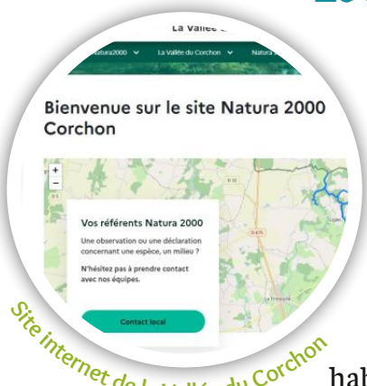
Site internet de la Vallée du Corchon

Toutes les informations liées au site Natura 2000 de la Vallée du Corchon sont désormais disponibles à l'adresse suivante : vallee-corchon.n2000.fr Vous y trouverez les dernières actualités, les rendez-vous à venir, le périmètre du site, les espèces d'intérêt communautaire qui y sont recensées ainsi qu'une brève présentation de leur biologie. Y figurent également les différents tomes du document d'objectifs, document qui cadre les priorités d'actions pour le maintien des habitats et des espèces d'intérêt communautaire.