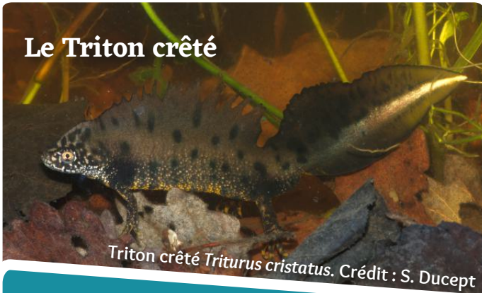
Triton crêté Triturus cristatus .

La couleur terreuse du dos de ce grand triton le rend quasiment invisible lorsqu'il est dans l'eau. Sa face ventrale, jaune à points noirs, tranche considérablement avec le reste du corps. Cette espèce rejoint les milieux aquatiques en janvier pour s'y reproduire. Il recherche les eaux stagnantes, en priorité des mares bien végétalisées, dans lesquelles les femelles pondront leurs œufs. Après cette période, les adultes connaîtront une phase terrestre au cours de laquelle ils gagneront les sous-bois, les pieds de haies dans l'attente d'une nouvelle saison des amours.