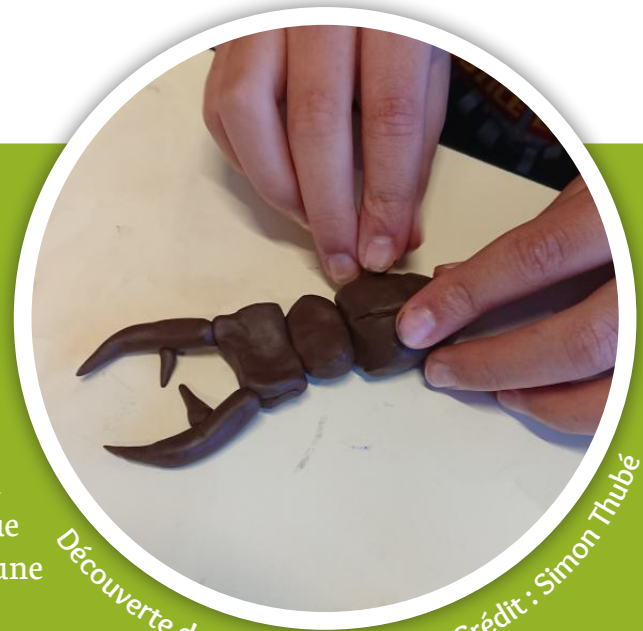
Découverte du Lucane cerf-volant.

La première séance leur a permis d'appréhender ce qu'était un insecte, comment les reconnaître, quelles sont leurs particularités morphologiques, comment les distinguer des autres petites bêtes et pour finir, ils ont pu découvrir quelques insectes protégés présents sur le site Natura 2000 de la vallée du Corchon. La seconde séance est dédiée à la compréhension du cycle de vie des insectes et à leurs différents modes de vie (différents types de milieux, régimes alimentaires et place des insectes dans la chaîne alimentaire). La troisième et dernière séance permet de finaliser l'acquisition de ces apprentissages par une sortie où les élèves sont amenés à utiliser identifier et classer différentes petites bêtes au travers de clés de détermination.