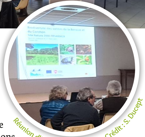
Réunion d'information en 2023.

C'est la commune de Thollet qui a aimablement accueilli la réunion publique annuelle sur la thématique de la biodiversité des vallées de la Benaize et du Corchon le 27 mars 2023. Une vingtaine de personnes se sont déplacées pour y assister. Ces réunions, en plus de présenter le site Natura 2000, sont l'occasion d'échanger sur les observations de chacun dans ce secteur encore très préservé du département. Notre prochain rendez-vous aura lieu à la salle polyvalente de Liglet le 28 mars 2024.