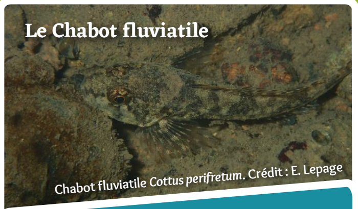
Chabot fluviatile Cottus perifretum .

Trois espèces de « poissons », dont le Chabot, sont considérées d'intérêt européen sur le site Natura 2000. Celui-ci est typique des ruisseaux frais aux eaux vives. Il aime s'y cacher sous les rochers et il fouille les sédiments à la recherche des invertébrés qui composent sa nourriture. Espèce compagne de la Truite fario et poisson-hôte de la Mulette épaisse, le Chabot est un indicateur de la bonne qualité des eaux. Cette espèce est menacée par le colmatage du fond des ruisseaux dû au piétinement par les animaux et aux étangs situés en amont et la pollution des cours d'eau.