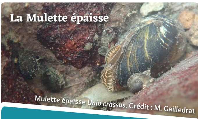
Mulette épaisse Unio crassus .

Unio crassus , de son nom scientifique, est une moule qui s'installe dans les sédiments qui composent le fond des cours d'eau. Les inventaires menés sur le cours du Corchon ont révélé sa présence ainsi que sur la Benaize. Elle y côtoie six autres espèces de Mulettes, toutes considérées comme patrimoniales.