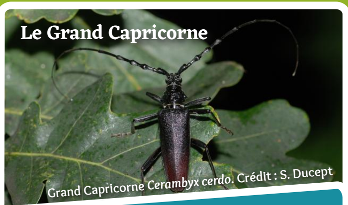
Grand Capricorne Cerambyx cerdo .

Voilà un scarabée majestueux dont la réputation, malgré qu'il soit protégé, le classe chez les « mal aimés ». Les adultes laissent derrière eux les traces de leur émergence, traduites par des perforations de forme ovale dans l'écorce des vieux arbres, souvent des chênes. Ces insectes s'attaquent aux arbres présentant des signes de faiblesse (blessures, attaques de pics, branches cassées...). Au fil de ses 31 mois de croissance, la larve ira de plus en plus au cœur du tronc. Elle préparera ainsi le terrain pour les champignons détritivores et une multitude d'espèces liées au bois mort.